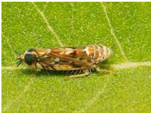
Mérete: 5 mm